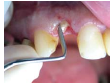
Mit Hilfe von Periotomen wird das Parodontium gelöst