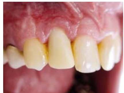
Provisorische Krone im abgeheilten OP-Gebiet