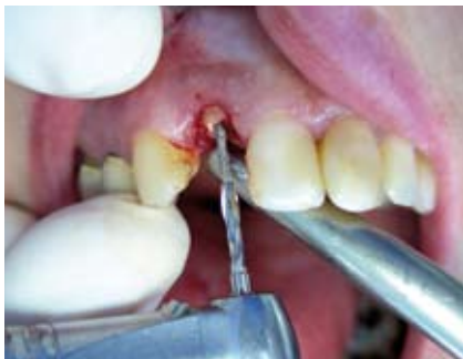
Mit Hilfe des diamantierten Spiralbohrers aus dem Benex-System erfolgt eine unterdimensionierte Bohrung in der Achse der Wurzel