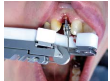
Das Zugseil wird in die Extraktorschraube eingehakt, über die Umlenkrolle das Extraktors geführt und am Haken des Extraktorschlittens eingehängt