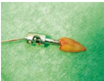
Durch kontrolliertes Drehen der Extraktorhandschraube wird der Schlitten langsam nach hinten bewegt und die Wurzel minimalinvasiv luxiert