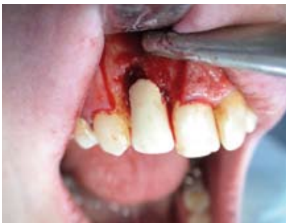
Provisorische Krone in situ