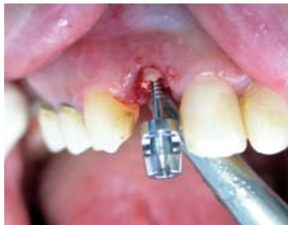
Die Extraktionsschraube wird mit dem passenden Imbusschlüssel vorsichtig eingedreht. Die Spiralbohrer und die Extraktionsschrauben gibt es in verschiedenen Längen und Durchmessern.