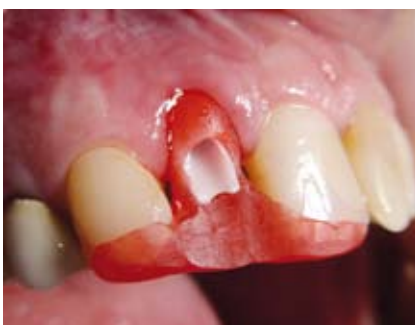
Verschraubung des definitiven Abutment mit Hilfe eines Kunststoffschlüssels