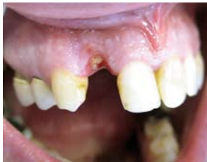
Kronenfraktur beim Extraktionsversuch

Bei dem Vorliegen dieses großen Hart- und Weichgewebeverlustes wäre klassischer Weise eine Augmentation indiziert gewe-