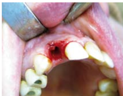
Alveole nach schonender Extraktion