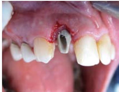
Provisorisches Abutment in situ