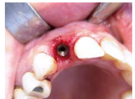
Sofortimplantation mit einem semados RI-Implantat.