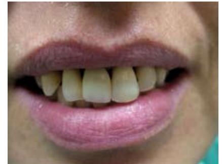
Abb. 18: Eine Woche nach Freilegung