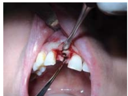
Abb. 12: freigelegtes Implantat