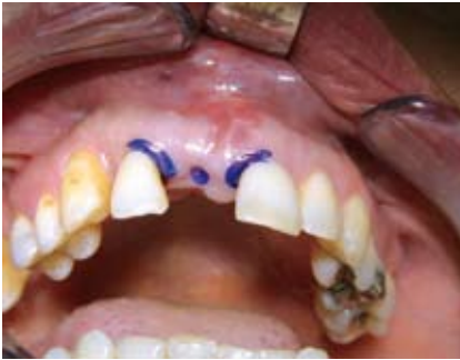
Abb. 1: Ausgangssituation