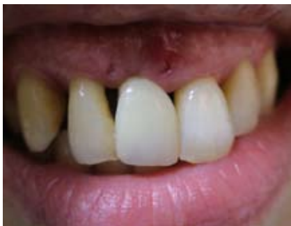
Abb. 19: Detailsicht