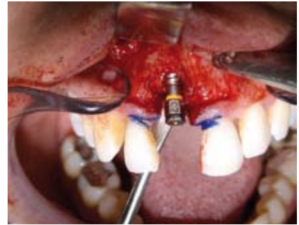
Abb. 3: Bonespreader mit Ø 3,1 mm