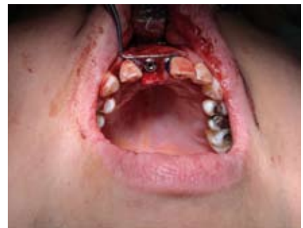
Abb. 6: Implantation