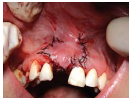
Abb. 9: Vernähter op-situs