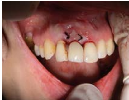
Abb. 17: Naht nach Freilegung