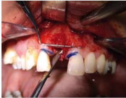
Abb. 2: Schnittführung, Knochendefekt