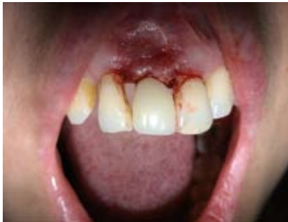
Abb. 16: zementiertes Provisorium