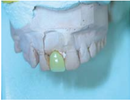
Abb. 13: provisorische Krone