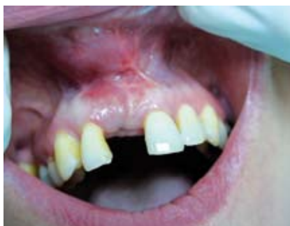
Abb. 11: Situs bei Freilegung