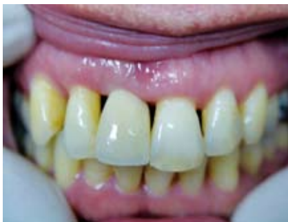
Abb. 22: Krone direkt nach Zementierung

Farbe und Form der endgültigen Krone zu „testen“, da man anhand der provisorischen Krone mit dem Patienten die definitive Krone variable gestalten kann (z.B. andere Farbe, tiefer liegenden Kontaktpunkt, Größenveränderung bei Lücken, Inzisalkantengestaltung u.ä.).