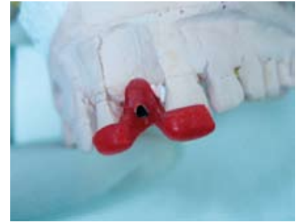
Abb. 15: Kunststoffschlüssel