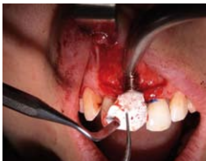
Abb. 8: Membranbefestigung