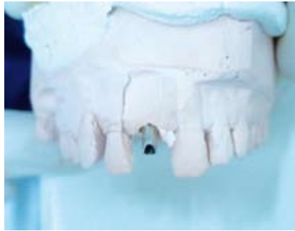
Abb. 14: definitives Metallabutment