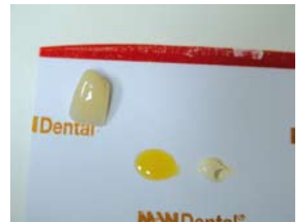
Abb. 21: definitive Krone, Temp Bond