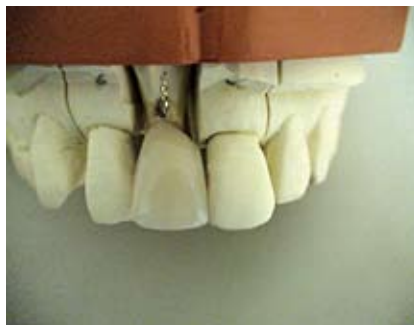
Abb. 20: definitive Zirkondioxidkrone